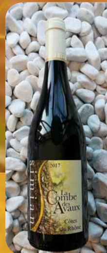
Côtes-du- Rhône « La Combe des Aaux »