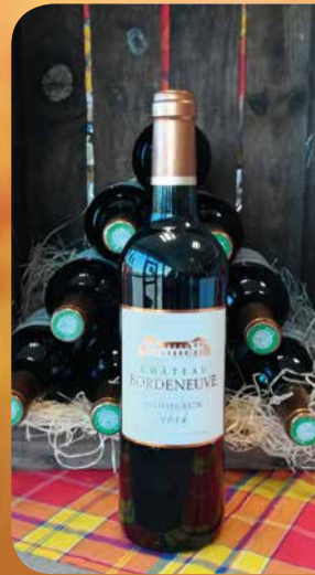
Bordeaux Château Bordeneuve