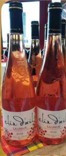
Saumur « Clin d'œil »