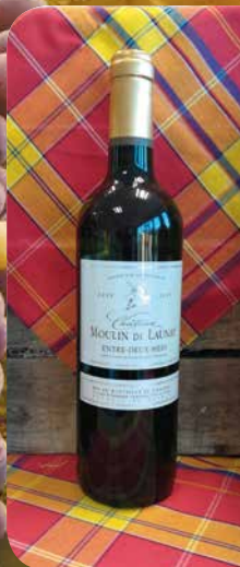
Bordeaux Château Moulin de Launay « Entre-deux- mers »