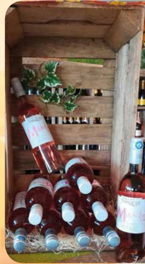
Tariquet « Marselan »